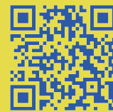
推薦書・募集要項

「A-LAB Artist Gate' 24 推薦書」に必要事項を記入の上、資料と共に受付期間内にメールまたは持参・郵送にて提出 ※推薦書・募集要項は A-LAB ホームページよりダウンロードできます。