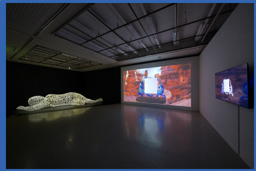
A-LAB Artist Gate'23 展示の様子