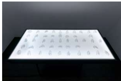
林葵衣《Phonation-piece---syllabary---》サイズ可変_ポリエチレン樹脂、ライトボックス_2022