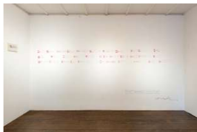
2017年個展「声の痕跡 Trace-of-voice」_会場風景